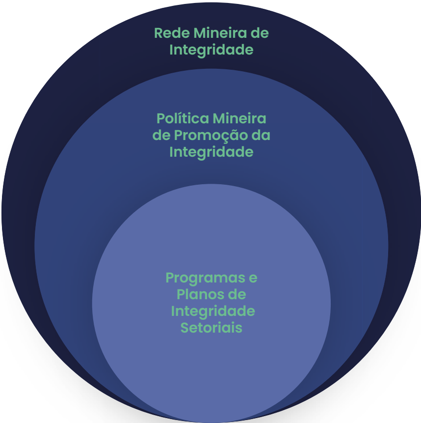
Figura 01 - Representação do sistema de integridade da Administração Pública do Estado de Minas Gerais, com foco no subsistema do Poder Executivo Estadual